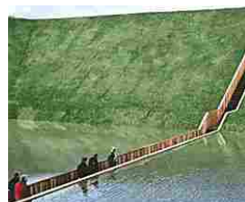
Questo è il ponte più