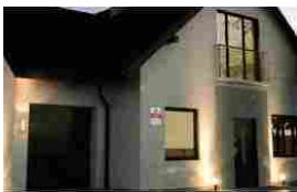
Sistema di allarme n.1 in