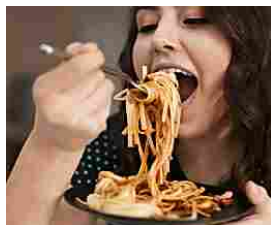
Milan: I tuoi dipendenti